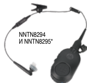
NNTN8294 И NNTN8295*

Радиостанции оснащены Bluetooth 2.1 , что позволяет быстро и безопасно подключать к ним различные устройства. Аксессуары Motorola с легкостью подсоединяются к радиостанциям и помогают обеспечить эффективность коммуникаций и безопасность пользователей в любой обстановке. Сотрудники полиции и служб безопасности могут переговариваться незаметно для окружающих, при том что их радиостанции стали еще более функциональными.