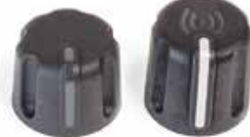
Стандартная кнопка регулировки

◀ Разноцветные кольца помогают идентифицировать радиостанции для групп с различными задачами, зоной покрытия или сменами.