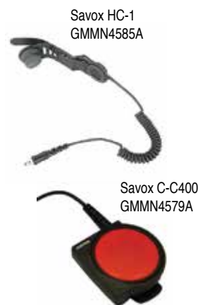
Savox HC-1 GMMN4585A

Вы также можете реализовать комплексное решение при помощи блока управления Savox C-C400 , который позволяет использовать двусторонние радиостанции в опасных условиях. Крупная переговорная кнопка предназначена для эксплуатации в экстремальных условиях и обеспечивает передачу сигнала даже при использовании под снаряжением или спецодеждой.